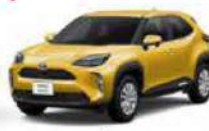
YARIS CROSS ヤリスクロス